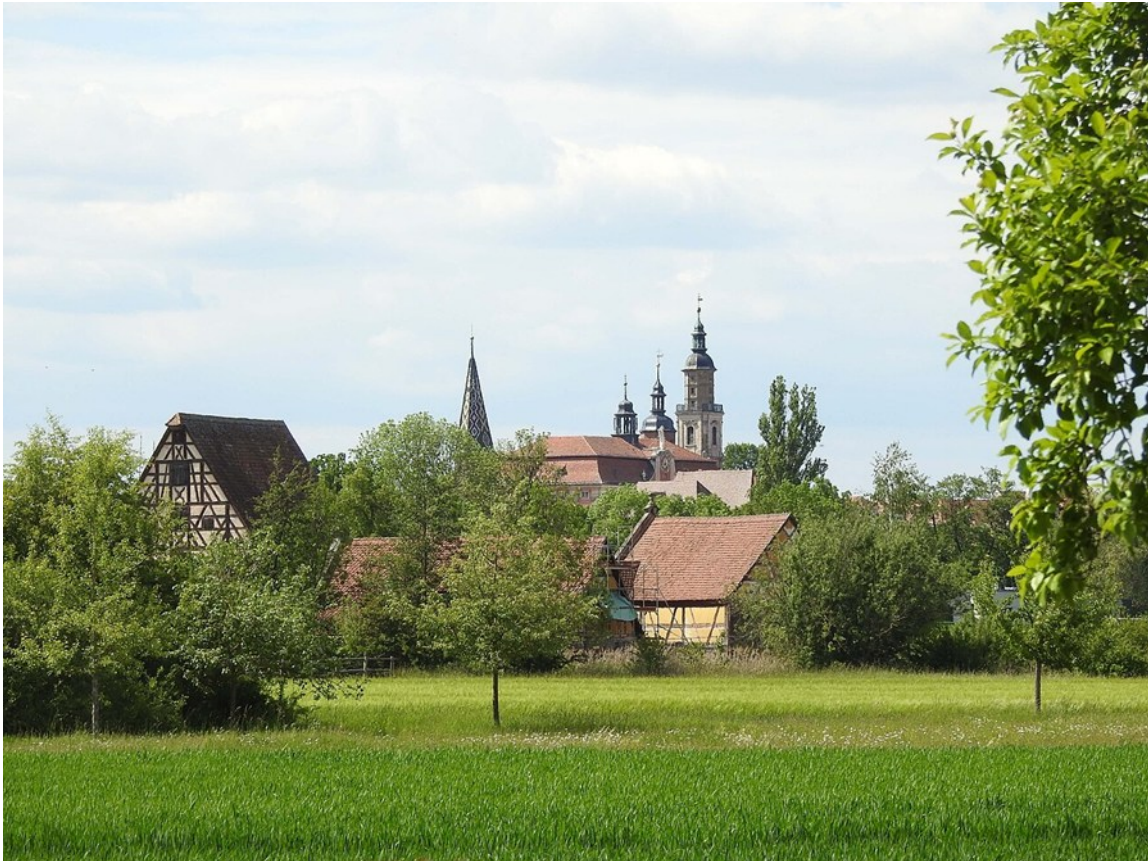
Foto: Bad Windsheim, vom Fränk. Freilichtmuseum ausgesehen, Wikicommons

Lange Zeit hielt man nur Kirchen, Schlösser, Burgen oder dergleichen bedeutende Bauten für bewahrenswert, bis die wirtschaftlichen, politischen und gesellschaftlichen Umbrüche im Laufe des 20. Jahrhunderts so gravierende Veränderungen mit sich brachten, dass auch die Zeugnisse des Alltagslebens vergangener Zeiten völlig zu verschwinden drohten. Die Reaktion darauf war die Gründung von Freilandmuseen, die vergangene Lebenswelten auf dem Land wenigstens museal erlebbar machen sollten.