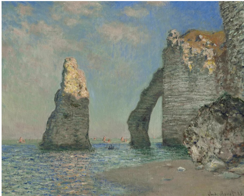
Bild: Claude Monet; Étretat, Öl auf Leinwand, 65,1 x 81,3 cm; Williamstown, Sterling and Francine Clark Art Institute

Ein französisches Fischerdorf wird zum Mythos. Étretat, in der Normandie an der Atlantikküste gelegen, zog im 19. Jh. zahlreiche Künstler in den Bann. Vor allem Claude Monet war von der einzigartigen Steilküste mit ihren drei Felsentoren – der Porte d'Amont, der Porte d'Aval und der Manneporte – derart fasziniert, dass er ihr etliche Gemälde widmete. Das Städel Museum präsentiert gemeinsam mit dem Musée des Beaux-Arts de Lyon eine große Ausstellung über die künstlerische Entdeckung von Étretat und den Einfluss des Ortes auf die Malerei der Moderne.