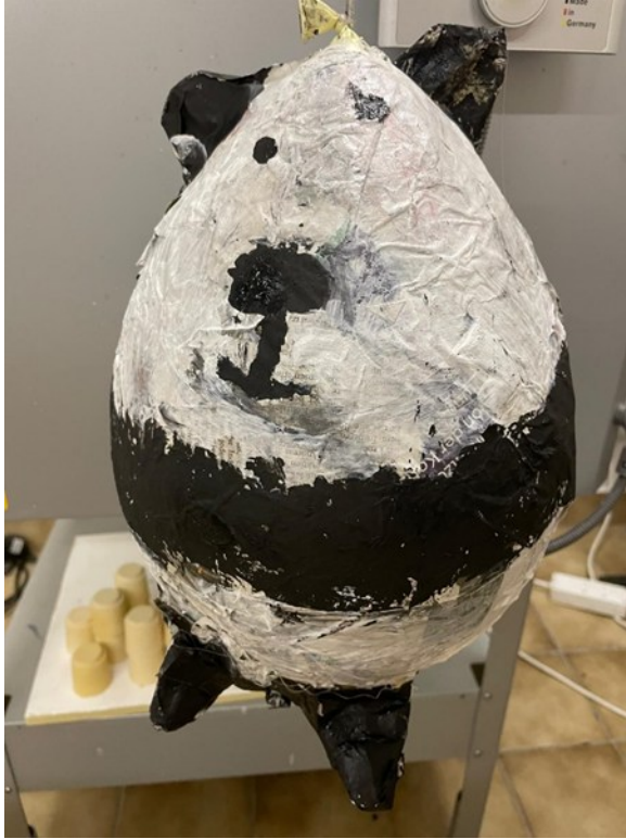
Foto: Bastelei mit Pappmaché

Entdeckt eine Welt der Kreativität in meinem Kurs „Kreative Woche“!