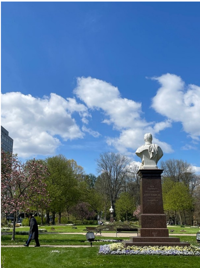
Foto: Claudia Germer; Bad Homburg; am Denkmal Kaiser Friedrich III

Sie architektonische Höhepunkte wie das Kaiser-Wilhelms-Bad und die Orangerie.