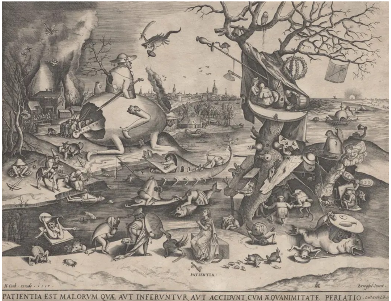
Bild: Pieter van der Heyden nach Pieter Bruegel d.A., Geduld (Patientia, 1557 / Kupferstich / Städel Museum, Frankfurt

Pieter Bruegel der Ältere (1526/30–1569) zählt zu den herausragenden Künstlern der niederländischen Kunst des 16. Jahrhunderts. Seine Werke entführen in eine faszinierende Welt humorvoller Bildideen und rätselhafter Motive. Heute vor allem als Maler bekannt, machte er sich bereits früh mit dem Entwerfen von Druckgrafiken einen Namen.