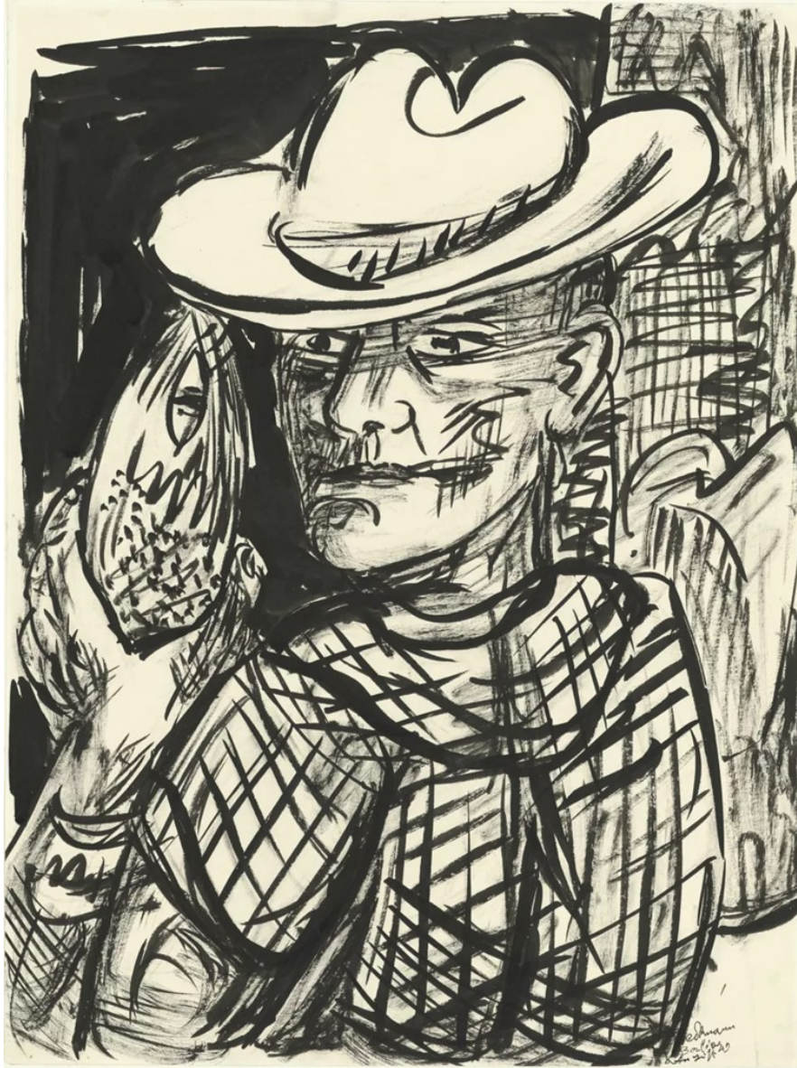
Bild: Max Beckmann, Selbstbildnis mit Fisch (1949); Frankfurter Kunsthalle

Das Städel Museum besitzt heute eine der bedeutendsten Beckmann-Sammlungen weltweit. Seit über 100 Jahren werden seine Werke gesammelt und erforscht. Im Winter 2025 richtet das Städel Museum nun den Fokus auf den Zeichner Max Beckmann (1884–1950). Rund 80 Arbeiten – viele davon erstmals öffentlich zu sehen – dokumentieren die Entwicklung seines zeichnerischen Schaffens von frühen Skizzen bis zu späten bildhaften Meisterwerken.