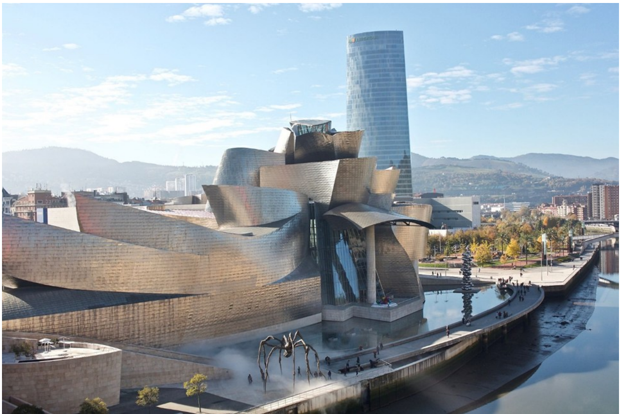
Foto: Museo Guggenheim, Bilbao von Naotake Murayama from San Francisco, CA, USA -, CC BY 2.0, https://commons.wikimedia.org/w/index.php?curid=5478225

Kulturreise (mit Flug) 29. April – 03. Mai 2026