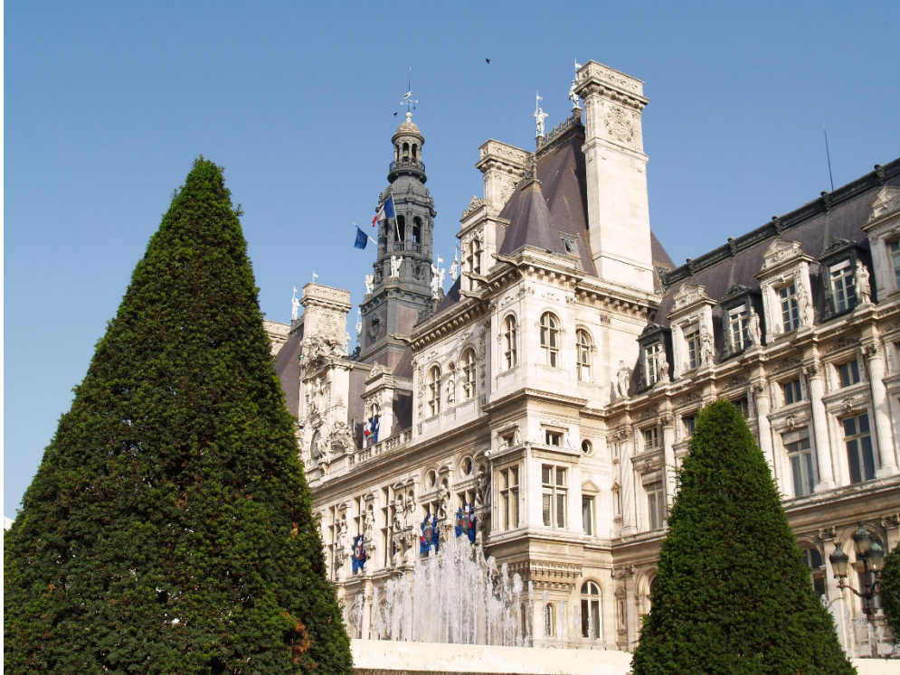
Bild: Rathaus, Paris

Wir starten früh mit dem TGV und erreichen um die Mittagszeit Paris, das wir nach dem Deponieren des Gepäcks im NH Hotel Paris Gare de l'Est auch gleich erkunden werden.