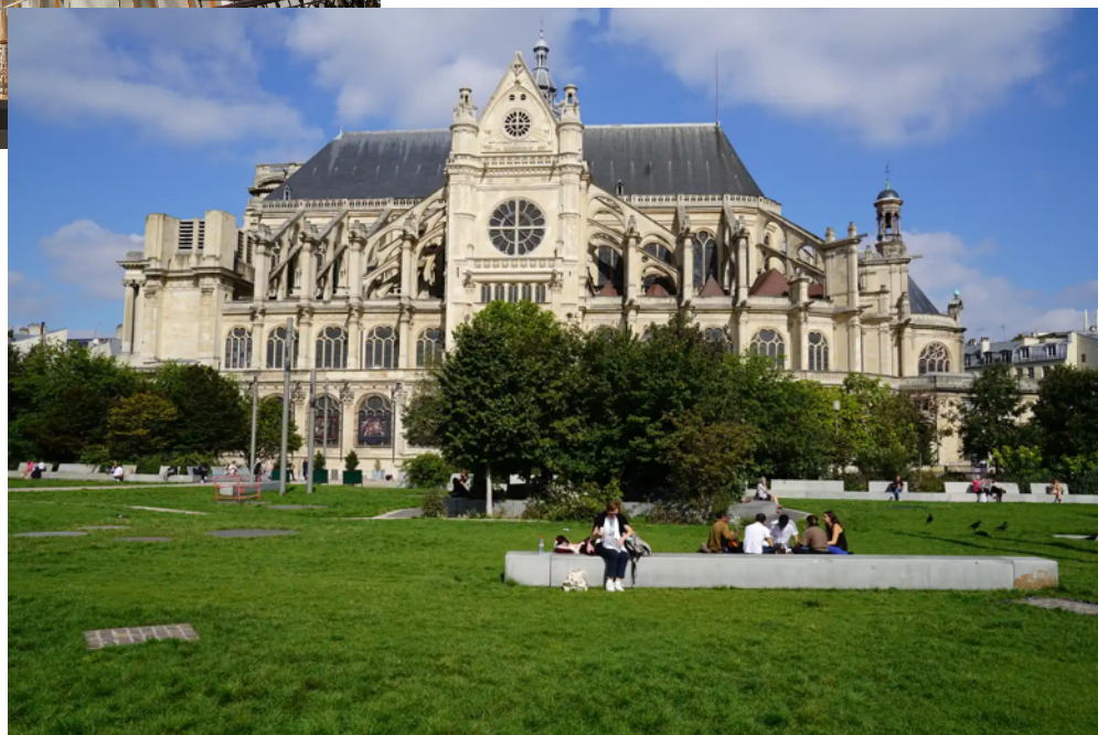
Bild: Kirche St-Eustache

Der Rest des Tages steht wieder zur freien Verfügung.